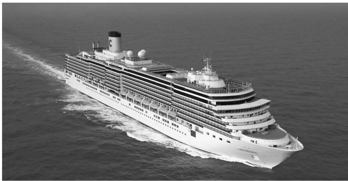
乘坐邮轮畅游大海

本次邮轮卡面向全省,限量发售500张卡。都市快报读者和旅行惠粉丝独家享有,先到先得!