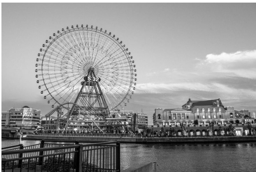
日本横滨夕阳美景